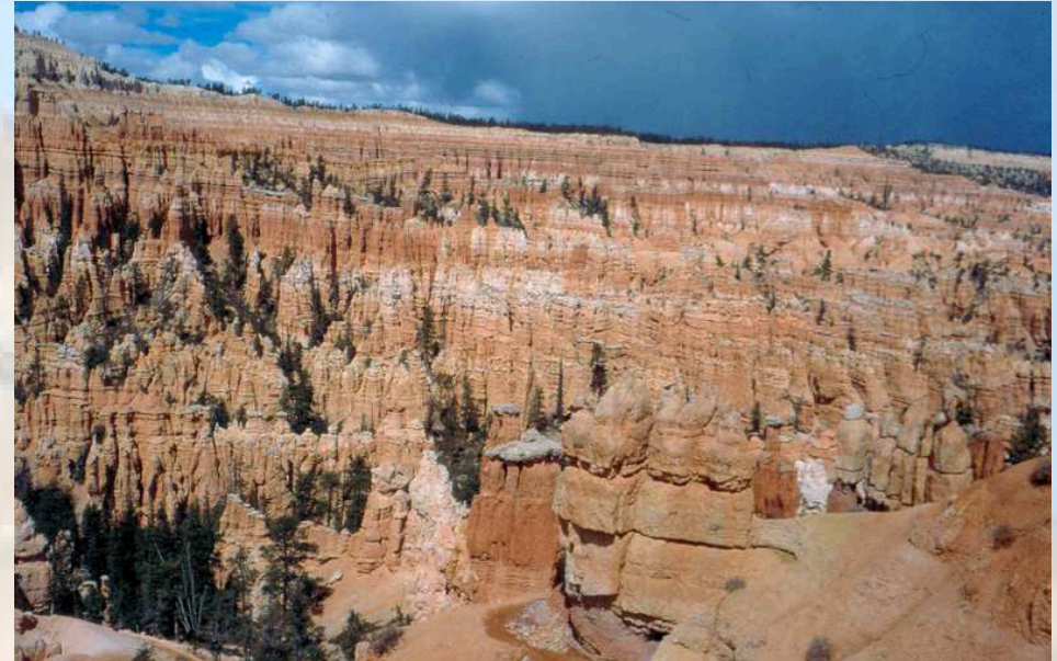
Sandsteinformationen im Bryce Canyon, Utah, USA.

Als Sandstein bezeichnet man ein klastisches Sedimentgestein, das überwiegend aus kleinen Quarzkörnern (Größe max. 2 mm) besteht. Im Unterschied zum reinen Quarzsandstein führen andere Sandsteine außer Quarz auch Karbonate (Kalksandstein), Feldspäte (Arkose) oder Tonminerale. Als Bindemittel, das die Körner der Sandsteine verkittet, können Tonminerale, Calcit ( \text{CaCO}_3 ) oder Quarz ( \text{SiO}_2 ) auftreten. Aus der Zusammensetzung des Sandsteines und dem Abrollgrad der Körner lassen sich Rückschlüsse auf das Herkunftsgebiet und den Transportweg ziehen.