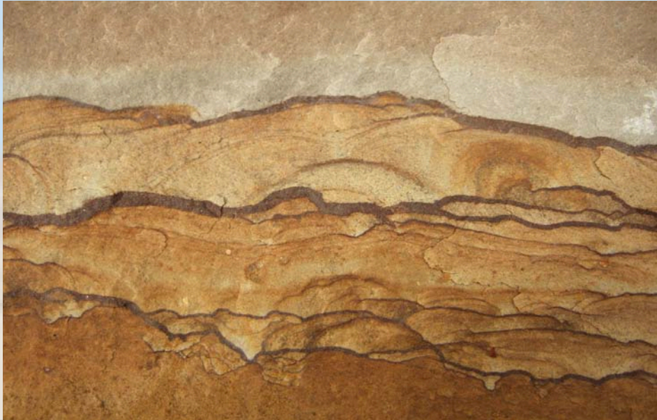
Nahaufnahme eines Sandsteines

Klastische Sedimente bzw. Sedimentgesteine (Kiese, Konglomerate, Sande, Sandsteine, Tonsteine usw.) bestehen aus den bei der mechanischen Zerkleinerung des Ausgangsgesteins entstandenen Gesteinsbruchstücken und Mineralen. Diese festen Verwitterungsprodukte werden durch Wasser, Wind oder Gletschereis in tiefer gelegene Bereiche (Ozeane, Becken) transportiert, dort abgelagert und verfestigt.