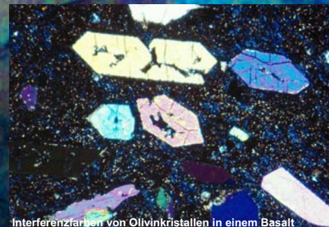
Interferenzfarben von Olivinkristallen in einem Basalt